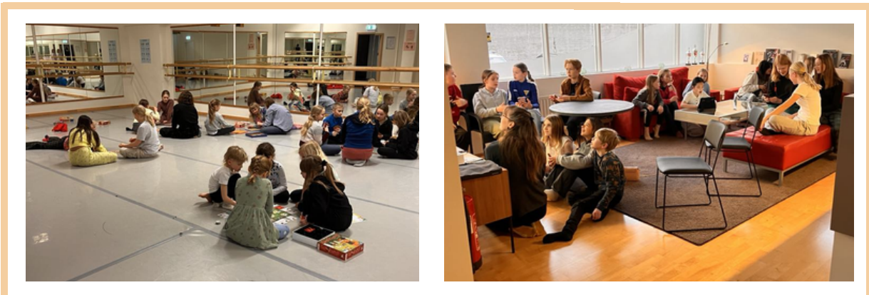
Myndir frá spila-/Kahootkvöldum

Foreldrafélag Dansgarðsins bauð upp á skemmtilega viðburði fyrir nemendur, fyrir 1. – 3. stig var það spila- og pizzukvöld í Óskanda á Eiðistorgi og fyrir 4. – 5. stig var það Kahoot- og pizzakvöld í KLS á Grensásvegi. Við erum þakklát fyrir frábært foreldrafélag.