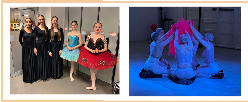
Myndir frá Safnanótt