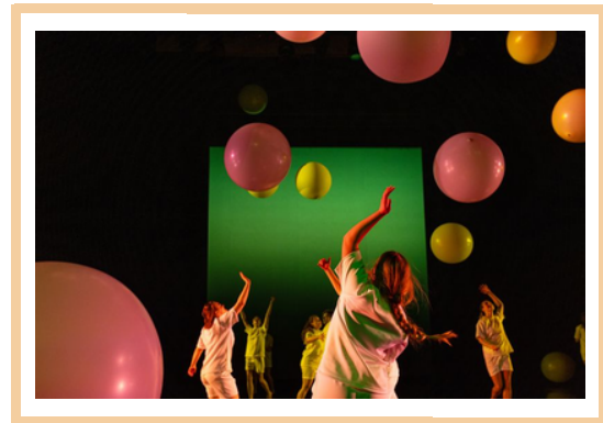
Mynd frá sýningu Íslenska dansflokksins Árstíðir