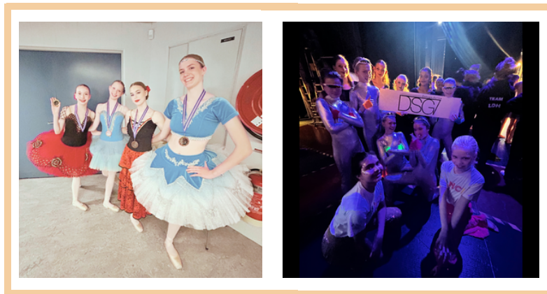
Myndir frá undanþekppi Dance World Cup