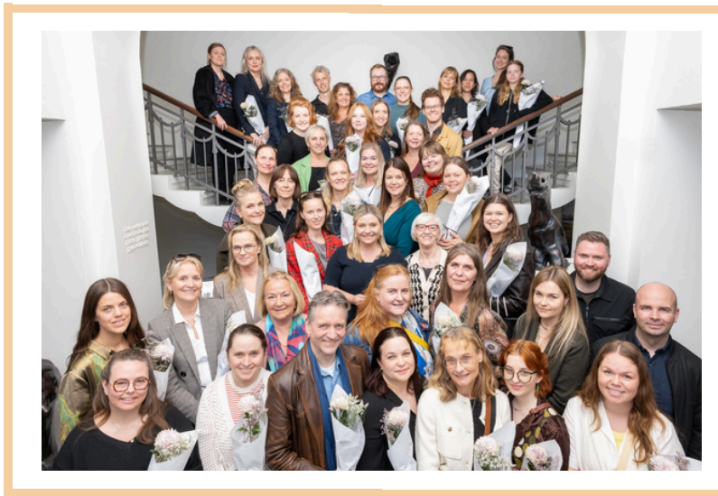
Mynd frá úthlutunaráthöfn Barnamenningarsjóðs

Við erum mjög þakklát fyrir stuðninginn!