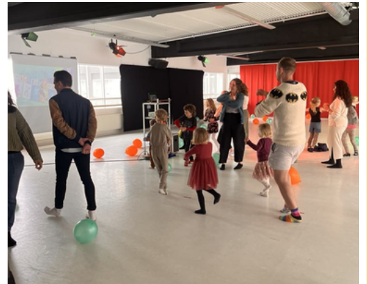
Myndir frá Sumargleði 2024