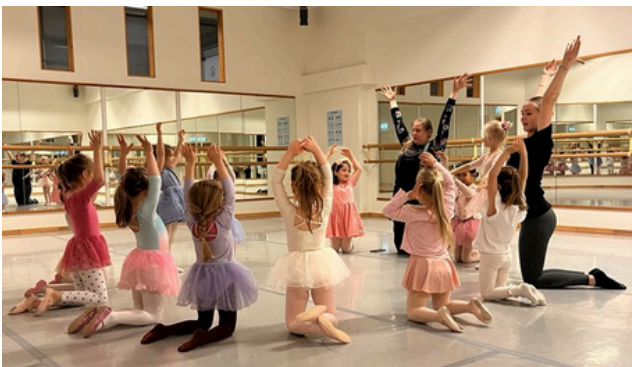
Mynd frá vornámskeiði hjá forskólanum