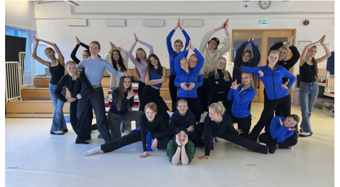
Heimsókn frá Finnlandi