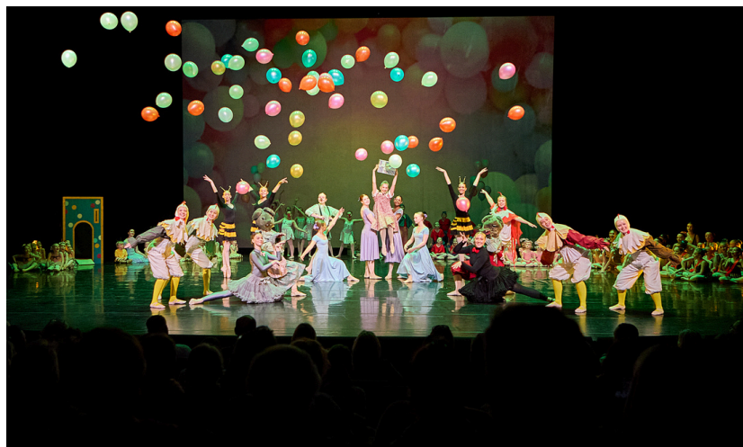
Myndir frá Vorsýning 2024

HÆGT ER AÐ SKOÐA ALLAR MYNDIR FRÁ SÝNINGUM Á DANSGARDURINN.ORG