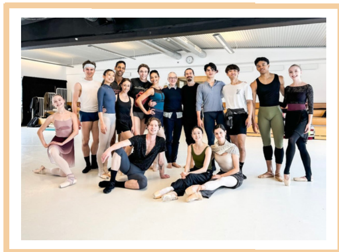
Dansarar Birmingham ballettsins í heimsókn á Grensásveginum