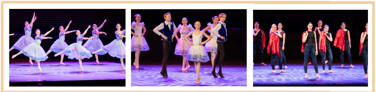
Myndir frá Barnamenningarhátíð