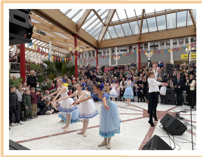
Mynd frá afmælishátíð Seltjarnarnesbæjar

Afmælisvorsýning var í Borgarleikhúsinu 30. apríl. KLS fagnaði 30 ára afmæli og Óskandi 5 ára afmæli. Foreldrafélagið gaf skólunum fallega búninga fyrir sýninguna. Sýningin var blanda af eldri verkum sem voru sett í nýjan búning og stóðu nemendur sig frábærlega! Færri komust að en vildu og var uppselt á seinni sýninguna.